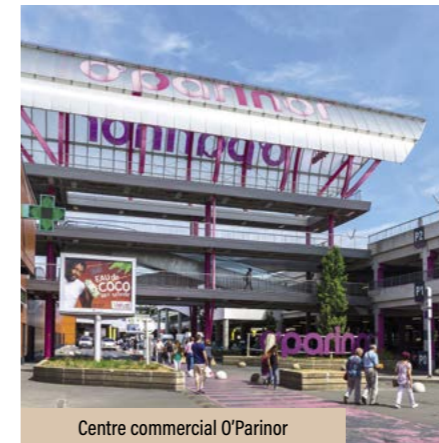
Centre commercial O'Parinor

Au cœur d'un pôle économique majeur de Paris Nord et au pied de la ligne 16 du Grand Paris Express