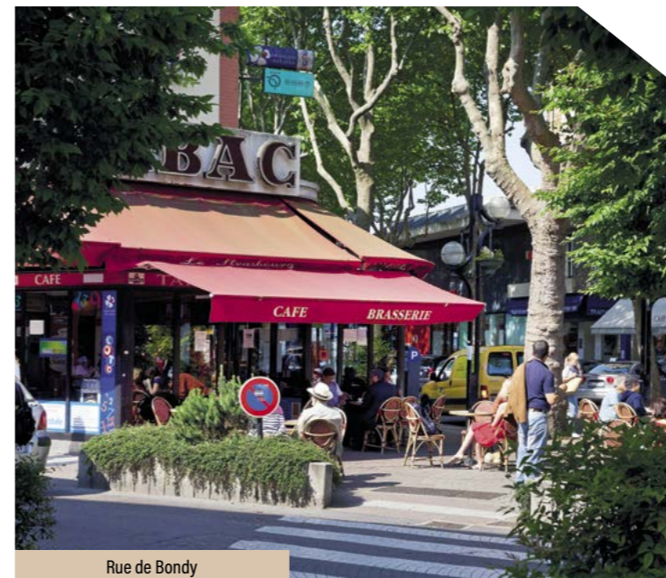
Rue de Bondy

À seulement 15 kilomètres de Paris, Aulnay-sous-Bois est une ville de banlieue qui propose un cadre de vie idéal. Avec l'arrivée imminente de la nouvelle ligne de métro 16 du Grand Paris Express en 2026, la ville sera très rapidement connectée à Paris.